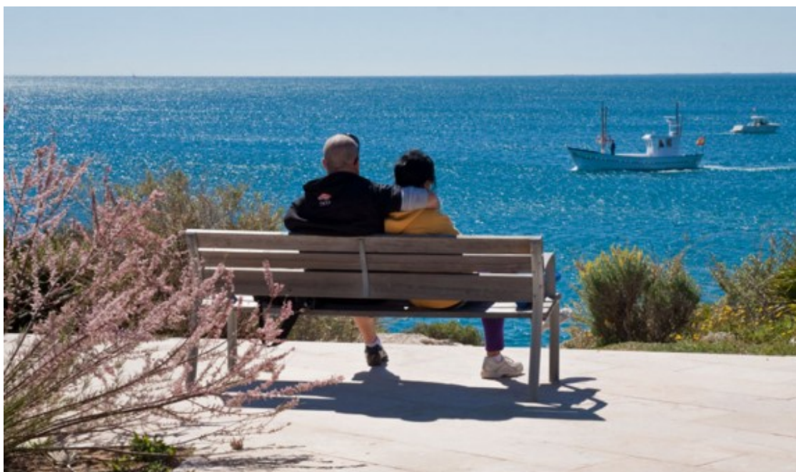
Imatge d'arxiu d'una parella a l'Ametlla de Mar durant un descans per Pasqua.

platges d'arena que de vegades es menja el mar són efectes òptics sense artificis. Han passat 37 anys i molta gent no mira amb nostàlgia aquell vol rasant de la multinacional ni el d'altres potser menys grandiloqüents i amb menys càrrega multimilionària, sinó més bé amb alleugeriment. Haver conservat l'essència, aliena inclús a parcs temàtics més propers i fins i tot a un urbanisme voraç que ha devorat quilòmetres de costa, obre altres oportunitats. A l'Ebre bateguen noves il·lusions i un repte cabdal, que passa per resoldre un oxímoron: que els visitants es multipliquen sense massificacions, que aporten més riquesa sense violentar el patrimoni natural ni pervertir la calma. Créixer sosteniblement en diuen. A l'Ebre hi ha només 14.468 places hoteleres . No arriben al 10% de les de tota la província de Tarragona, amb 172.109 . Per tant quan es donen en conjunt dades d'ocupació, l'impacte econòmic no és comparable ni de lluny.