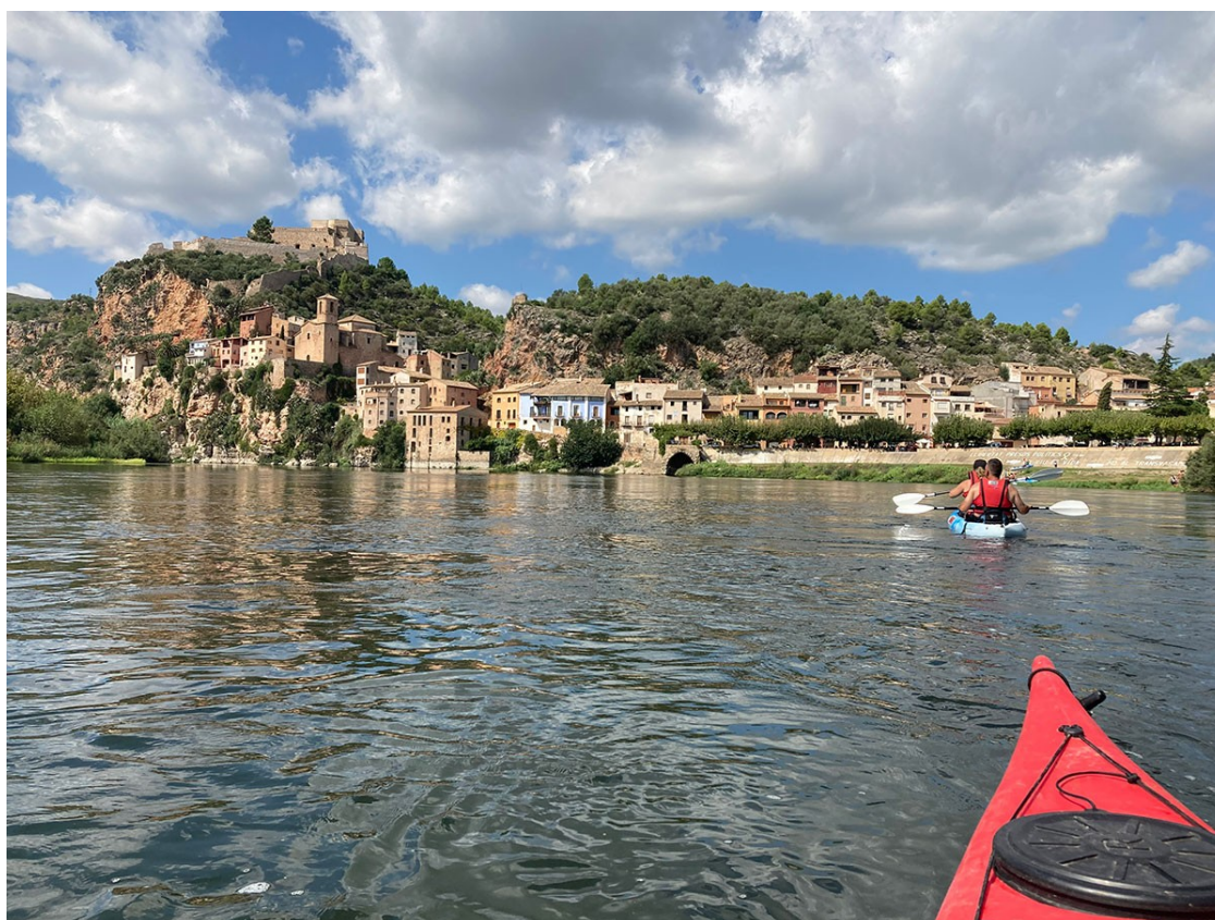
Piragüistes baixant pel riu Ebre fins a Miravet.

Promoció conjunta, regulació d'accés a espais en risc de massificació i desestacionalització, les claus de futur per a un territori que busca alternatives