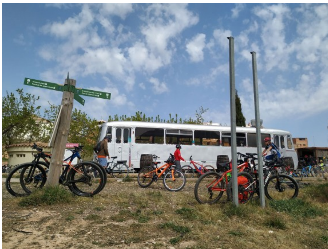
Ciclisme per la Via Verda, a l'estació de Bot.

Les Terres de l'Ebre volen treure pit d'haver-se sabut preservar de grans inversions predatoras mostrant els mateixos paisatges que eren abans, amb el permís d'alguna incongruència com un desplaçament excessiu de la indústria energètica, nuclear primer, eòlica més recentment.