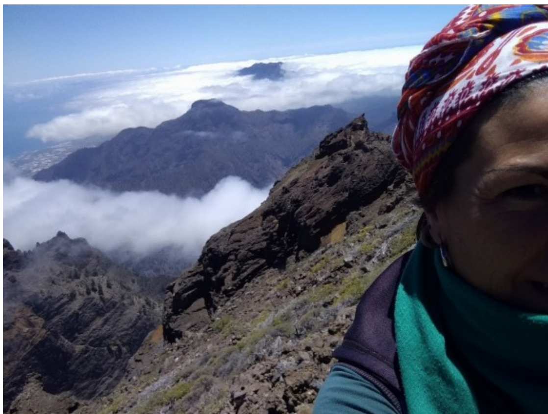
Des del cim d'una muntanya

La natura és una font inesgotable de recursos , inspiració, caos, calma, vida i lliçons. Natura de naixement, naturam sequi (seguir a la naturalesa).