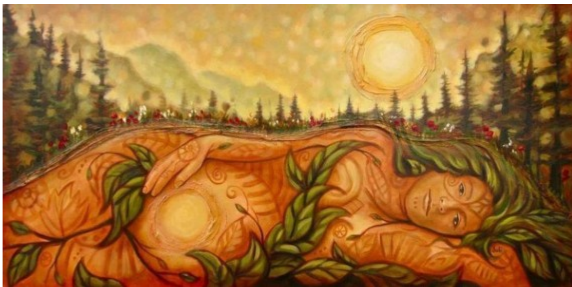
Mare terra, pachamama

Aturada, m'arriba Gaia, el mite que personifica la fertilitat de la Terra, que sense ajuda de cap element masculí va engendrar ella sola el cel, les muntanyes i el mar.