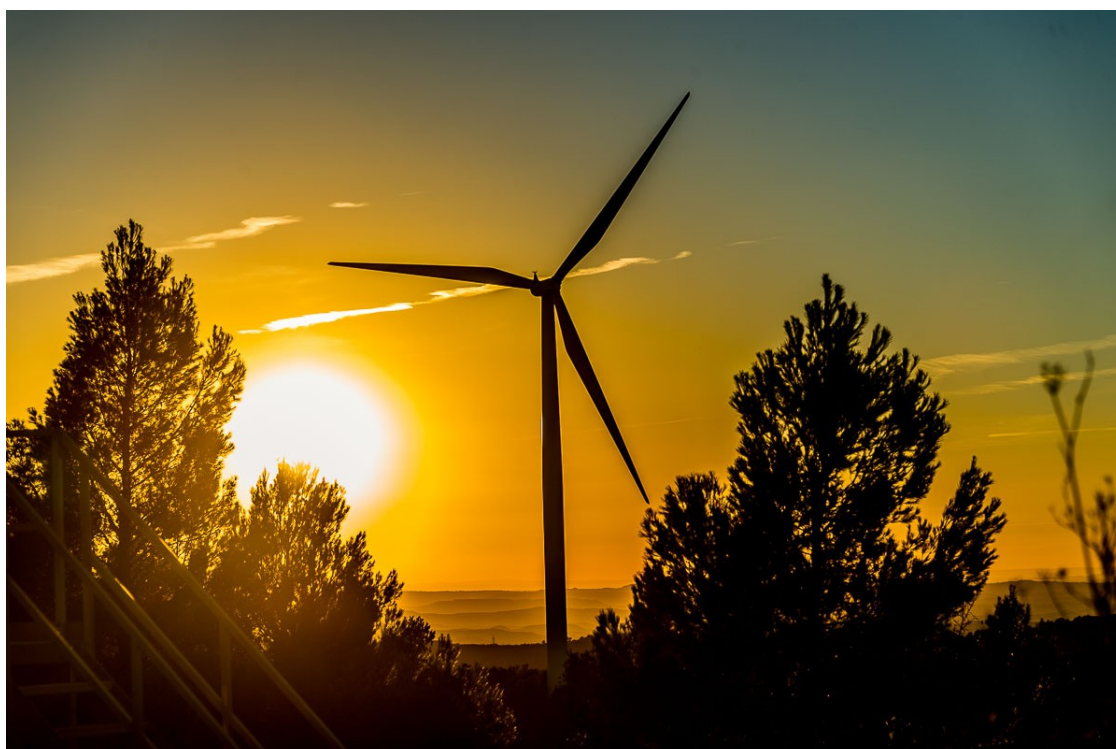
Un aerogenerador a Catalunya | Josep M. Montaner

La Generalitat accelera la implantació per complir amb la llei del canvi climàtic i topa amb alcaldes i ambientòlegs