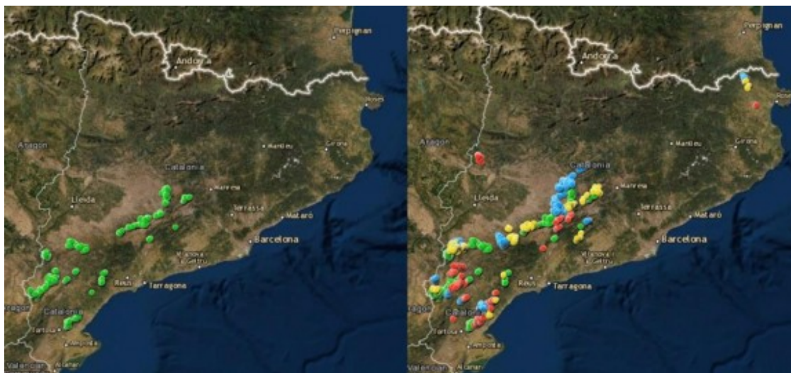
El mapa eòlic del 2020 i els projectes de parcs per als pròxims anys

( http://mediambient.gencat.cat/ca/05_ambits_dactuacio/avaluacio_ambiental/energia_eolica/visor/ ), a Catalunya hi ha ara 45 parcs eòlics on funcionen 811 aerogeneradors, una xifra que s'ampliarà previsiblement ( https://www.naciodigital.cat/lleida/noticia/41787/macroprojecte-cinc-parcs-eolics-entre-segria-ribera-ebre-avalat-generalitat ) després que la ponència d'energies renovables, l'òrgan col·legiat integrat per representants de diferents departaments de la Generalitat amb competències en medi ambient, energia i urbanisme, haja segellat la viabilitat de 9 nous parcs i de 257 molins més. Fent l'equivalència en potència eòlica, dels 1.271 megawatts actuals s'hauria de passar a 4.000 d'aquí deu anys i a 12.000 el 2050, any que també s'assoliran 37.000 megawatts d'energia fotovoltaica.