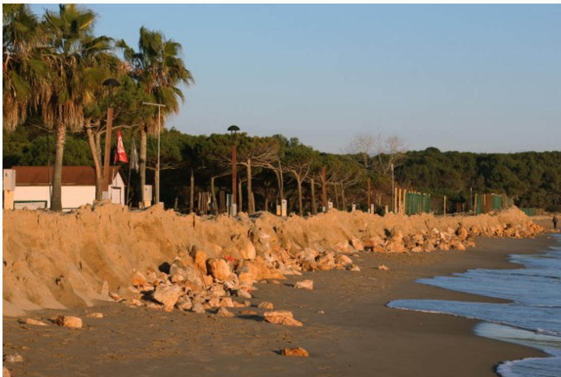
El mur del càmping Las Palmeras, a la platja Llarga de Tarragona.