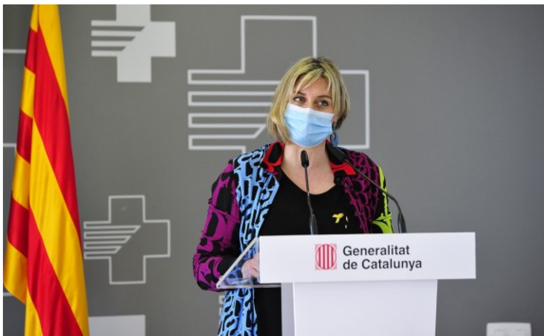
La consellera de Salut, Alba Vergés, ha comparegut este divendres per explicar el projecte

L'alcaldesa de Tortosa, Meritxell Roigé, ha subratllat que l'inici d'estes obres és ?una reivindicació que es ve fent des de fa molt de temps, segurament massa temps? . Per això, ha insistit a la consellera que este ha de ser ?un compromís ferm i ràpid, perquè no ens podem permetre de nou generar frustració al territori?. Segons Roigé "la gent ja està cansada d'anuncis. El que demanem és que això siga una realitat i no un element situat avui per la proximitat d'una contesa electoral?", ha expressat en referència a la proximitat de les eleccions del 14-F.