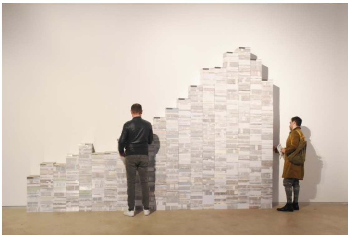
Ejercicio volumen, una gran gràfica feta amb fulls de prova d'impremta. Cada full representa un mort per homicidi a Veneçuela entre el 1999 i el 2018. Quedava pendent la columna del 2019, que tot just acaba de finalitzar.